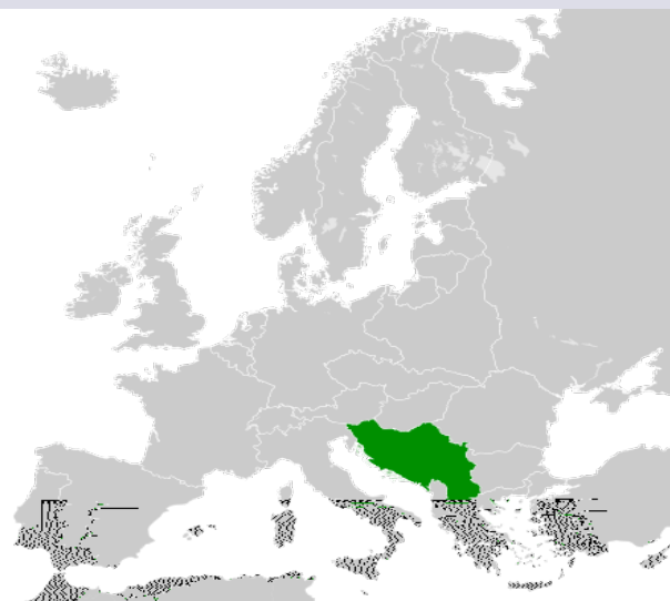
http://sh.wikipedia.org/wiki/Kraljevina_Jugoslavija , 5. ožujka 2012.